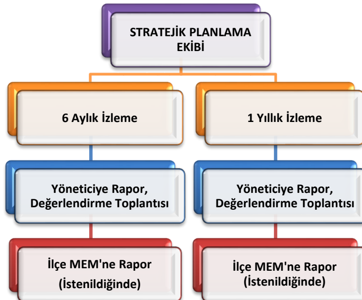
Şekil 8 Stratejik Plan İzleme ve Değerlendirme Modeli

Yazıkent Mürşide Akçay İlkokulunun 2024-2028 Stratejik Planı İzleme ve Değerlendirme sürecini ifade eden İzleme ve Değerlendirme Modeli hazırlanmıştır. Okulumuzun Stratejik Plan İzleme-Değerlendirme çalışmaları eğitim-öğretim yılı çalışma takvimi de dikkate alınarak 6 aylık ve 1 yıllık sürelerde gerçekleştirilecektir. 6 aylık sürelerde Okul Müdürüne rapor hazırlanacak ve değerlendirme toplantısı düzenlenecektir. İzleme-değerlendirme raporu, istenildiğinde İlçe Milli Eğitim Müdürlüğüne gönderilecektir.